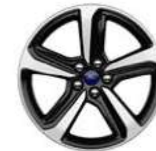
Aluminio de 18"