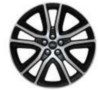
Aluminio Pintado de 20"

Los colores mostrados pueden variar de acuerdo a la resolución de pantalla, favor de consultar especificaciones de color con su distribuidor autorizado Ford antes de realizar su compra.